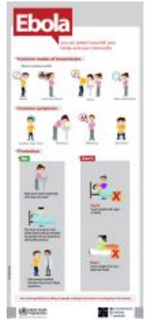
إبولا - نصائح وقائية