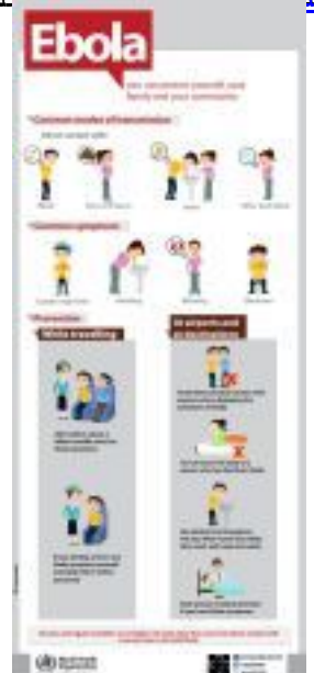
إبولا - نصائح وقائية