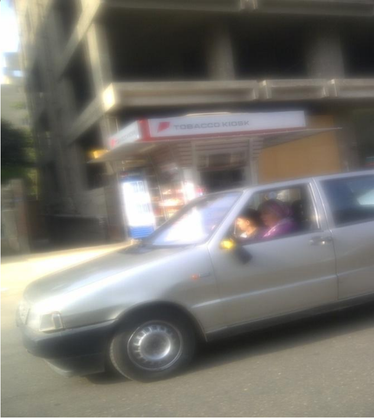
الاعلان على الأكشاك وتحويلها كاملة إلى إعلان