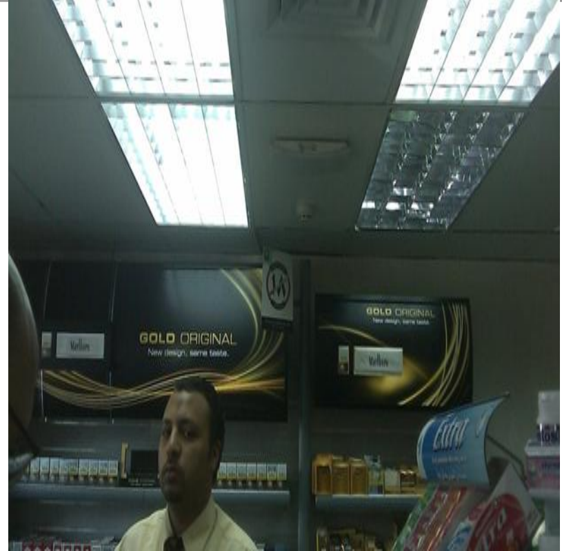
الاعلان في نقاط البيع