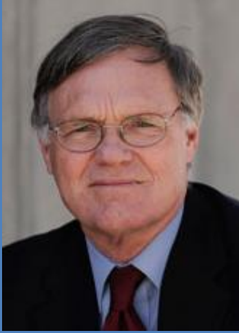
البروفيسور دونالد ماك راى عينته الحكومة الأسترالية