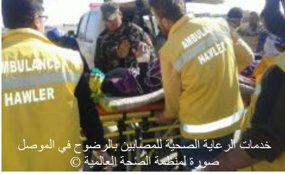
خدمات الرعاية الصحية للمصابين بالرضوح في الموصل

■ ستسحب مديرية الصحة في نينوى القوى العاملة الصحية من مراكز الرعاية الصحية الأولية في "شام حسن"، و"خازير"، ومخيمات "الدباغة"، وتترك مسؤولية توفير الرعاية الصحية الأولية لمديرية الصحة في أربيل.