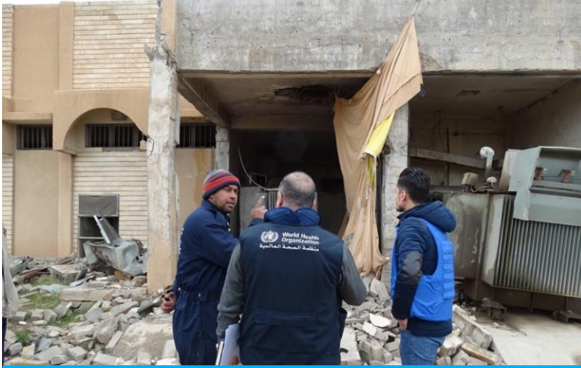
العاملون في منظمة الصحة العالمية أثناء تقييمهم لأحد المراكز الصحية في "تلكيف" مؤخرًا خلال بعثة تقييم للوكالات الدولية.

المستشفى. كما زار العاملون في المنظمة مستشفى "القبارة" للتأكد من جودة تقديم الخدمات الصحية وتقييم حالة المستشفى من حيث تقديم الرعاية التالية للعمليات الجراحية على مرضى الرضوح. وتشير نتائج الزيارات إلى أن أعمال الترميم التي تقوم بها المنظمة غير الحكومية الشريكة "منظمة التحالف من أجل النساء والصحة" قد بدأت، ولكن تلك الأعمال لا تزال في مراحلها الأولية.