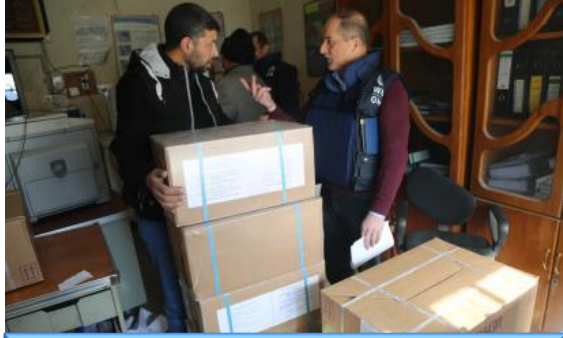
عاملون من منظمة الصحة العالمية يسلمون إمدادات الطوارئ الطبية إلى المكتب الصحي في منطقة "القيارة" لدعم الاستجابة للنازحين والمجتمعات