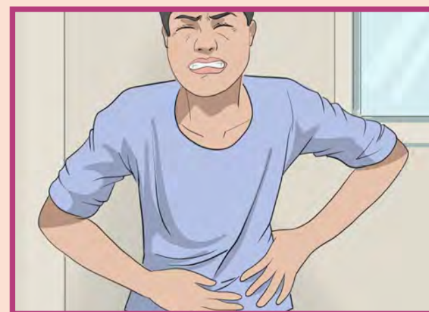
درد شدید شکم