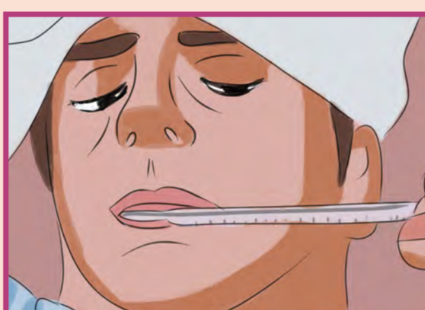
تب همراه با کاهش دمای بدن (زیر ۳۸ درجه سانتیگراد)