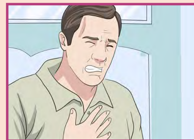
تند نفس زدن