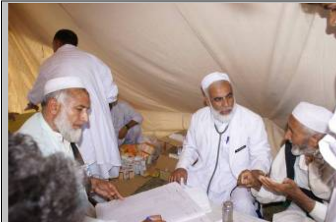
Services de santé du camp de populations déplacées de Sheikh Shahzad, Mardan