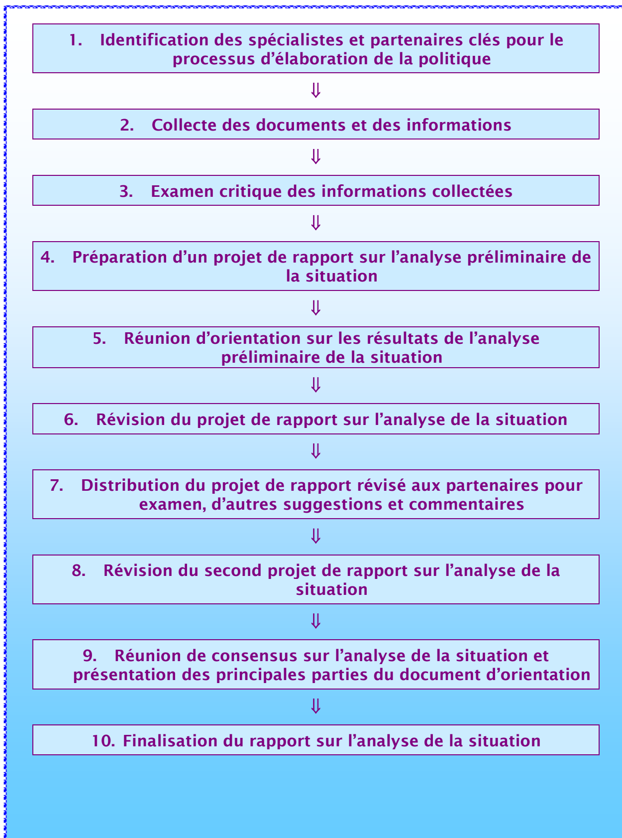
Figure 2. Les 10 étapes de l'analyse de la situation