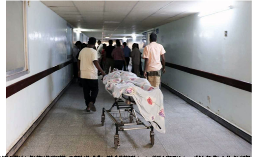
في مستشفى في صنعاء، اليمن، حيث يعاني الكثيرون من الجوع والمرض والحرب من يعانون مدنيون: الحديدية من وجوه