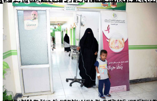
في صنعاء، اليمن، حيث يعاني الكثيرون من الجوع والمرض والحرب من يعانون مدنيون: الحديدية من وجوه