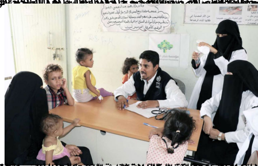
في صنعاء، اليمن، حيث يعاني الكثيرون من الجوع والمرض والحرب من يعانون مدنيون: الحديدية من وجوه